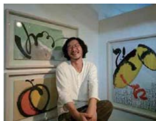
①韓国書藝家キムムンテ