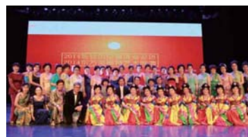
③韓国ニューシニアライフ