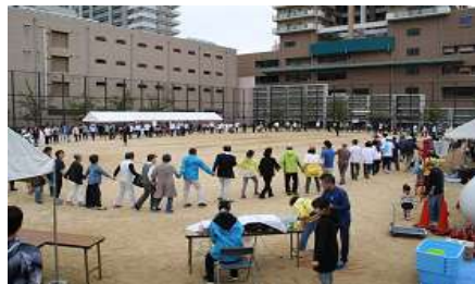
フィナーレは全員輪になって カンガンスオルを踊る