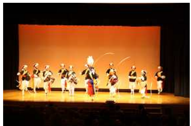
サムルノリやプンムルを披露する 氷丘中学校国際交流部の皆さん