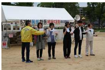
各県代表による選手宣誓

去る10月14日(土)若松公園運動場(鉄人28号横)において、駐神戸総領事館の主催による民団5県(兵庫・岡山・鳥取・香川・徳島)合同運動会が開催されました。天気予報では雨の予想でしたが、何とか無事に全種目を消化することができました。民団5県は駐神戸総領事館の管轄地域ではありませんがその範囲は広く、遠方から多くの同胞、留学生が集まり、お互いに親睦と交流を深めてゆくよい機会となりました。