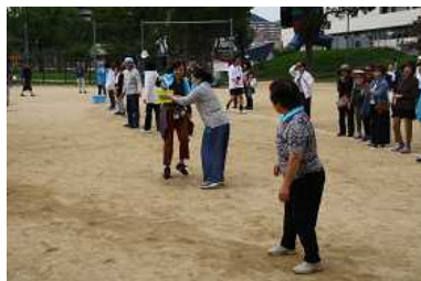
防災訓練も兼ねての バケツリレー